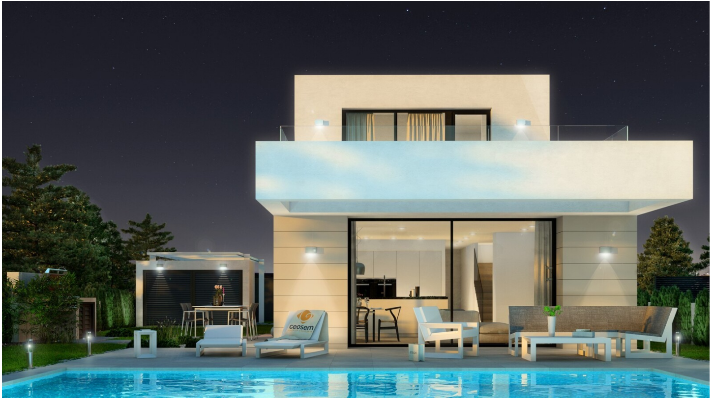
03187 La Herrada | Costa Blanca South | Project | Référence: CBLS1907-15319