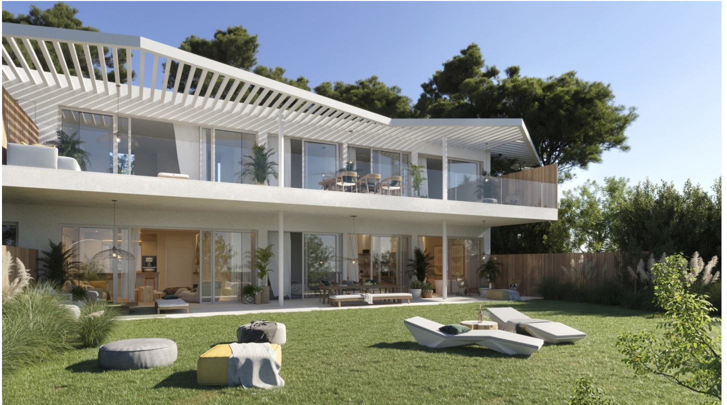
29640 Reserva del Higueron | Costa Del Sol | Building | Référence: CDSL10860-15942