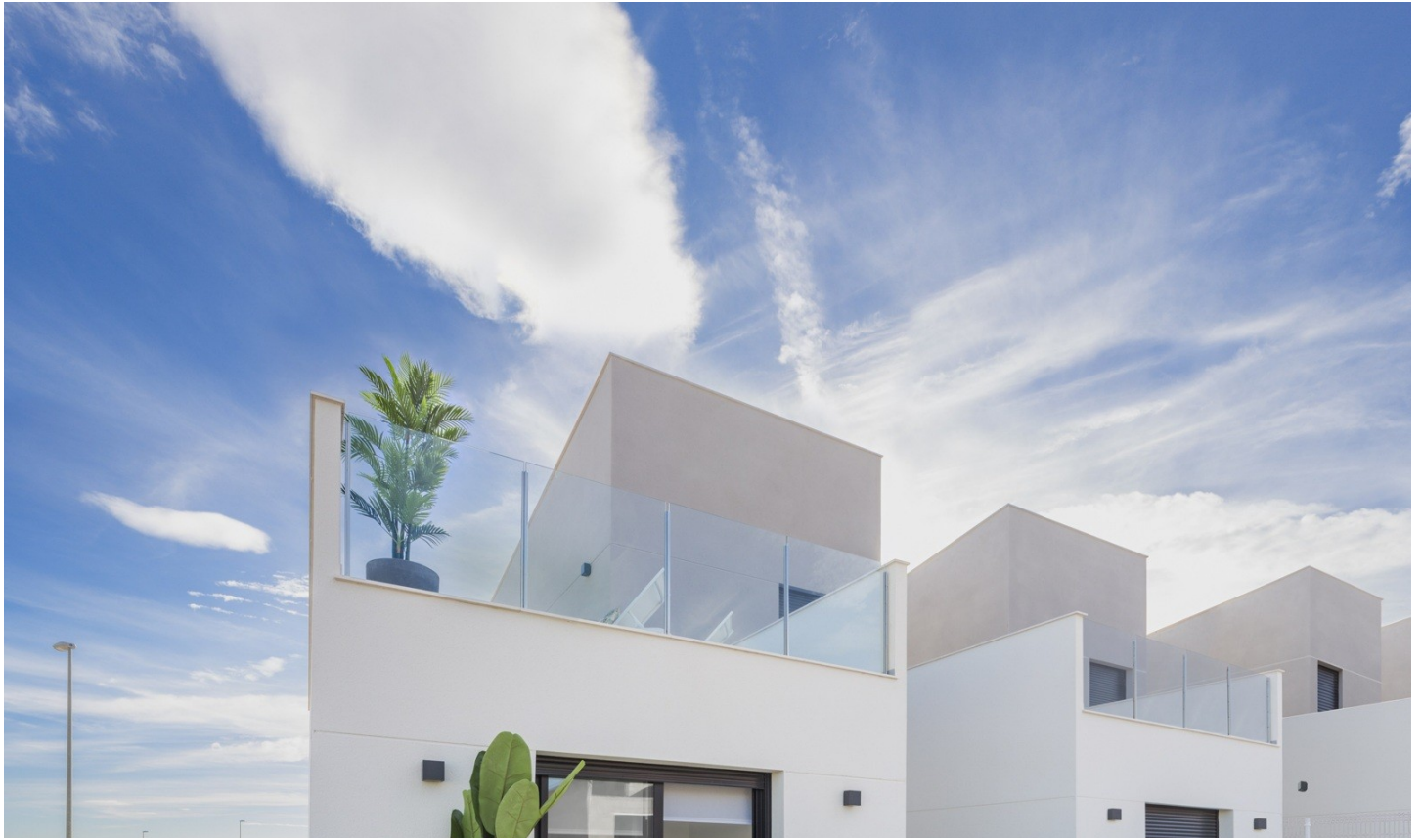
30155 Altaona Golf | Costa Calida | Project | Référence: CCAL11476-15244