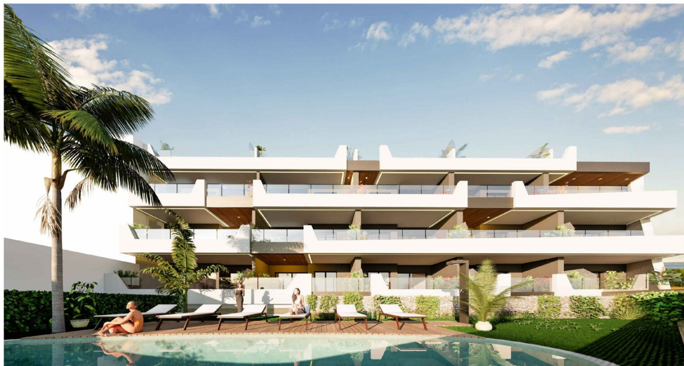
03178 Benijofar | Costa Blanca South | Project | Référence: CBL11870-15007