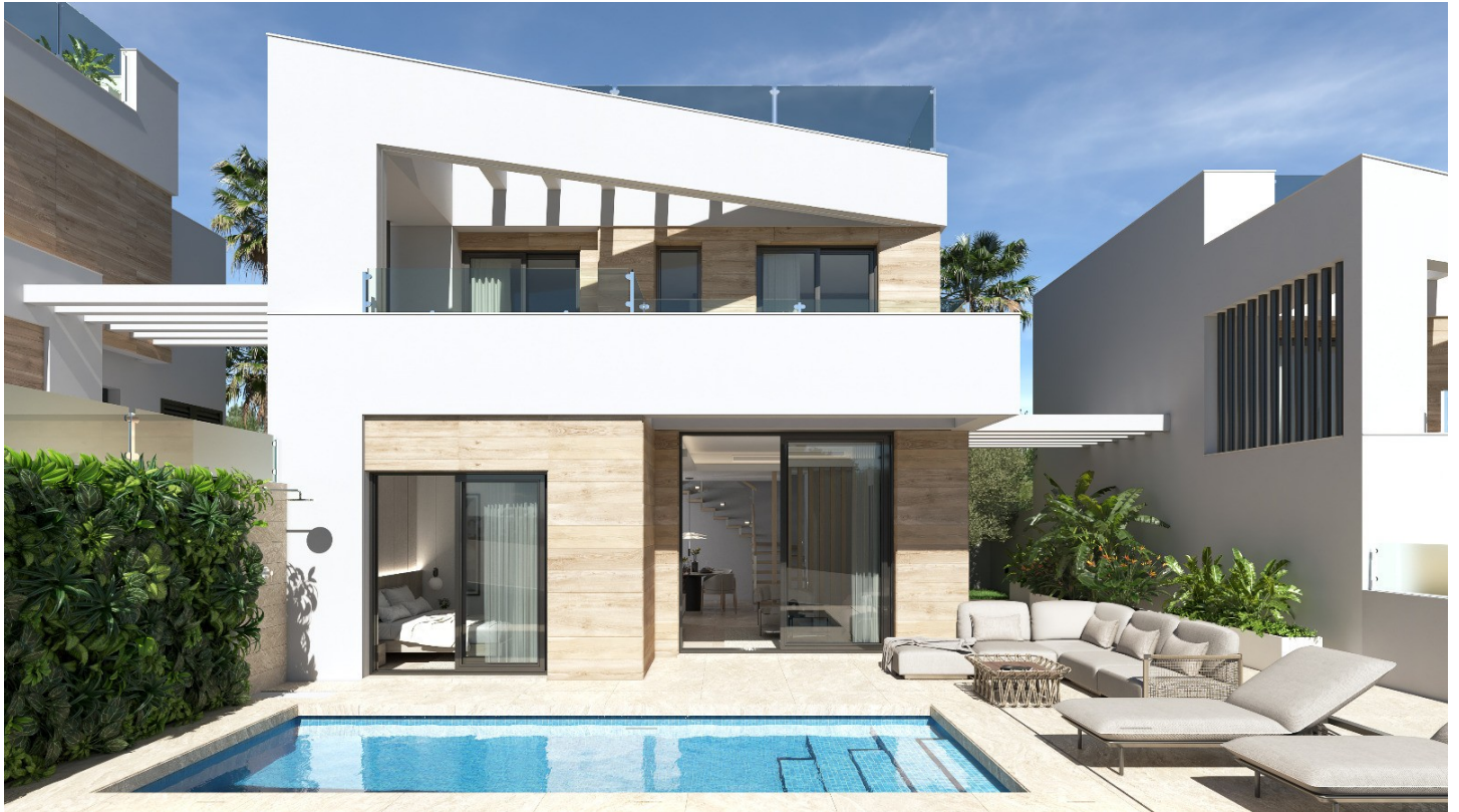
03189 Villamartin | Costa Blanca South | Project | Référence: CBL515215-14922