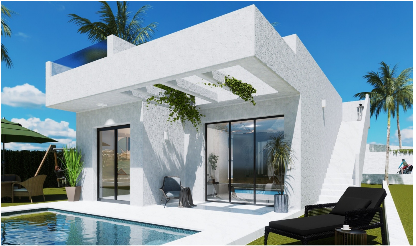
03169 La Finca Golf | Costa Blanca South | Project | Référence: CBLS15669-15293