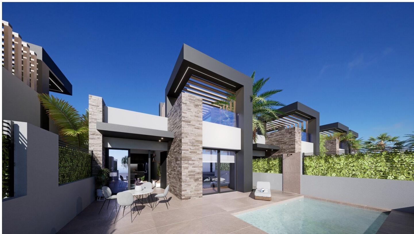
03177 San Fulgencio | Costa Blanca South | Project | Référence: CBLS16976-15645