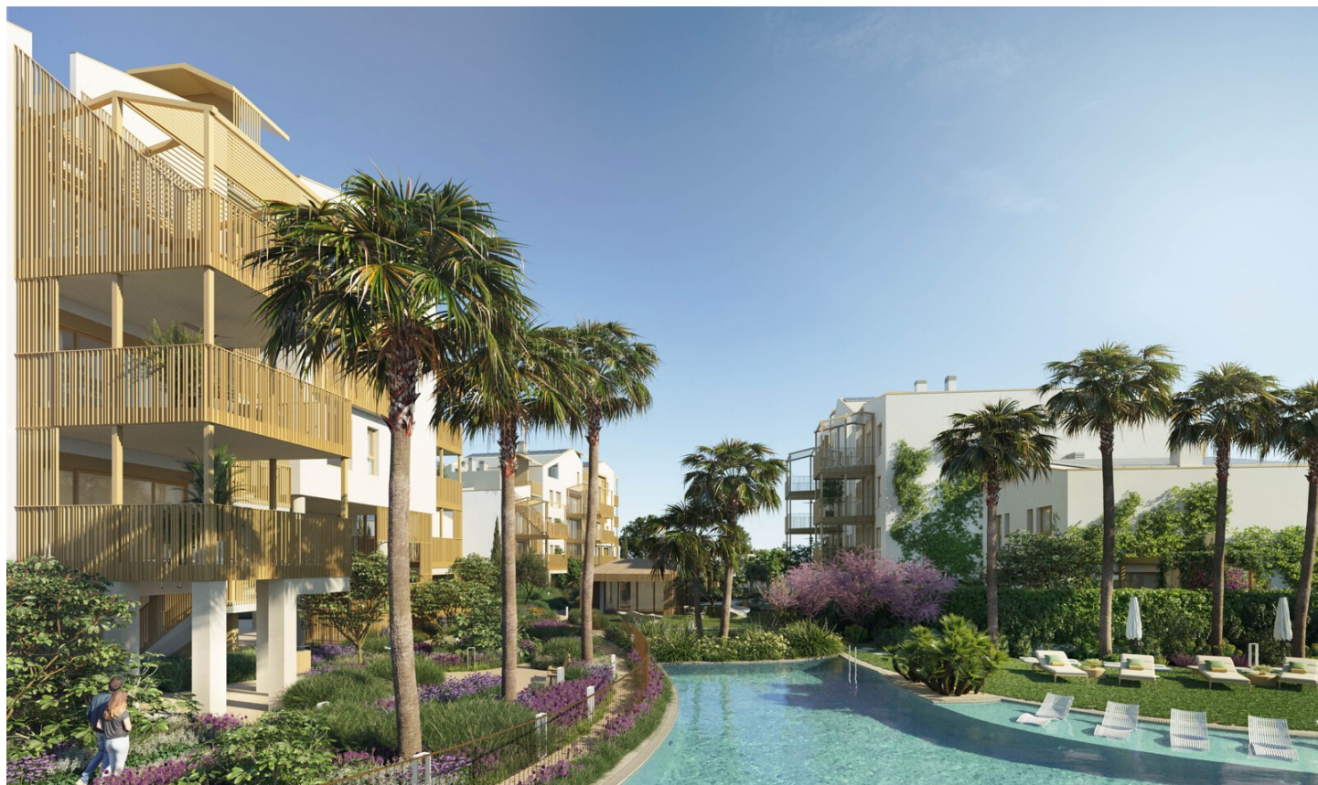
03770 El Verger | Costa Blanca North | Project | Référence: CBLN21003-19069