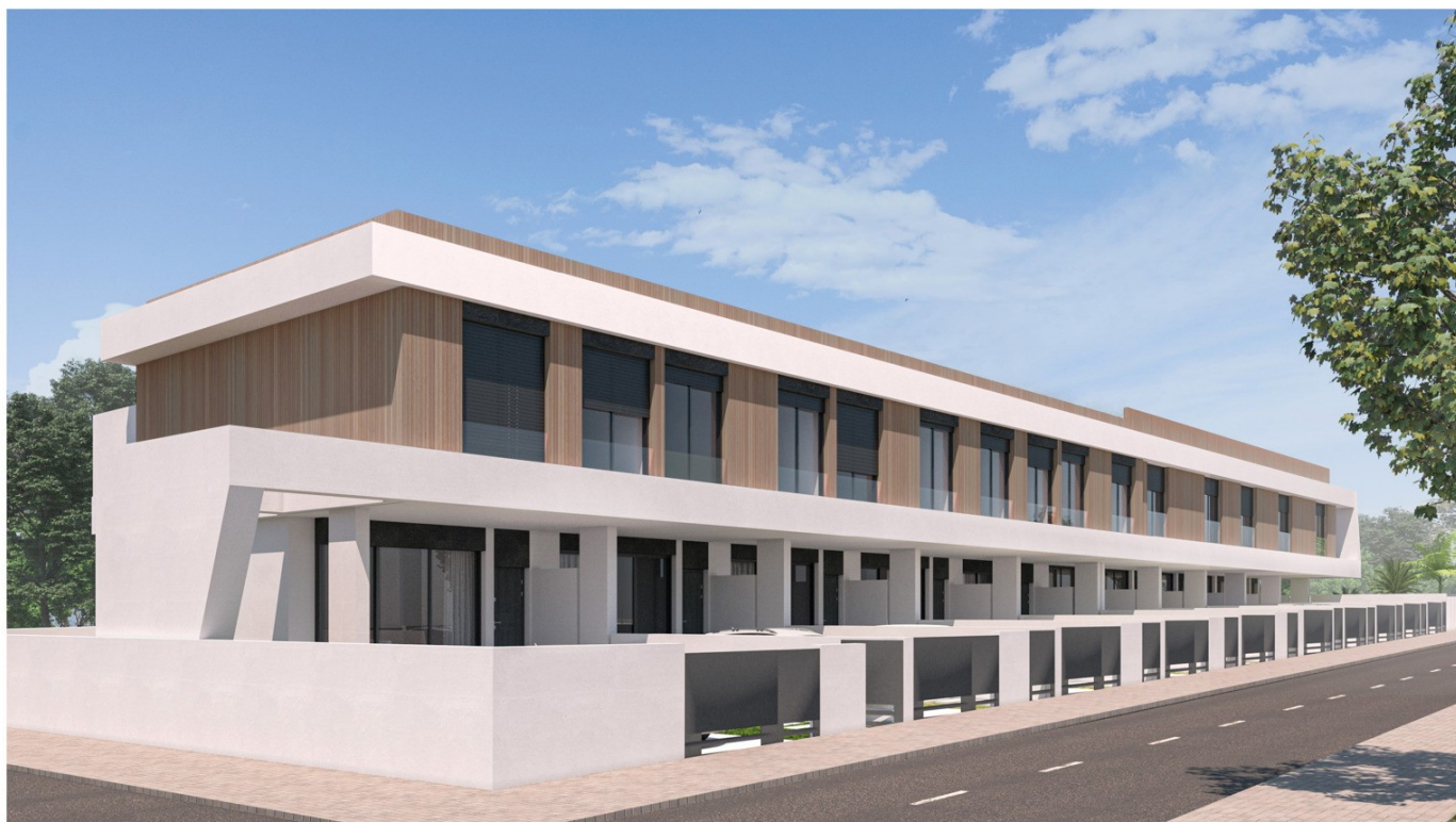
03190 Pilar de la Horadada | Costa Blanca South | Project | Référence: CBLS21800-19870