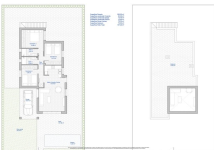
FASE 2 - MANZANA 32