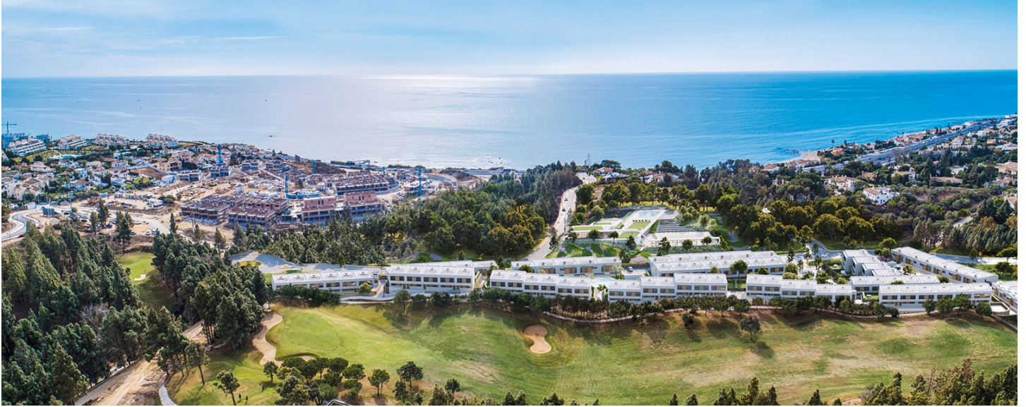
29649 La Cala de Mijas | Costa Del Sol | Gebouw | Referentie: CDSL9511-16173