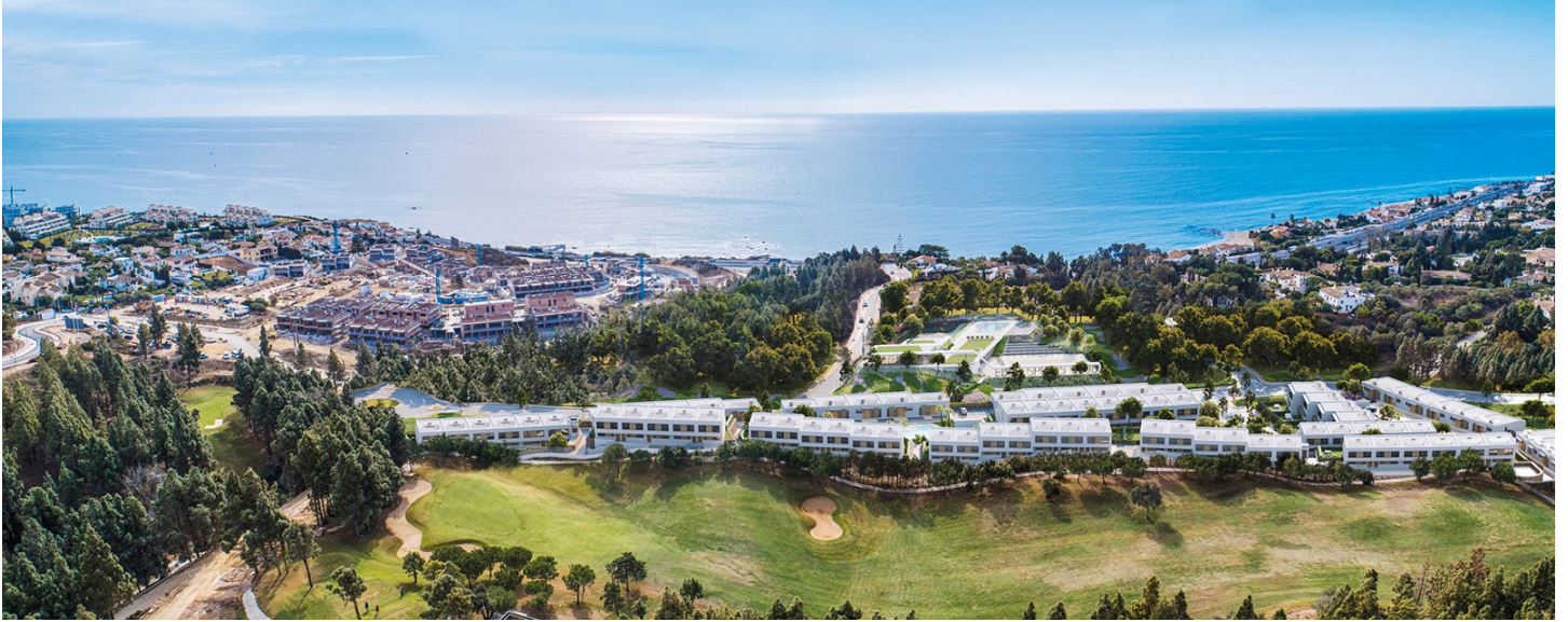
29649 La Cala de Mijas | Costa Del Sol | Gebouw | Referentie: CDSL9511-16175