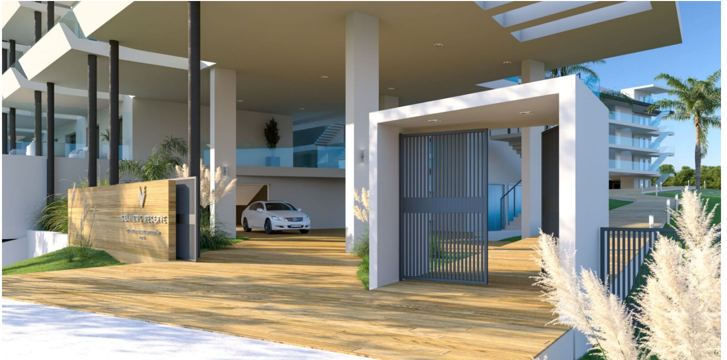
29640 Fuengirola | Costa Del Sol | Project | Referentie: CDSL9933-15217