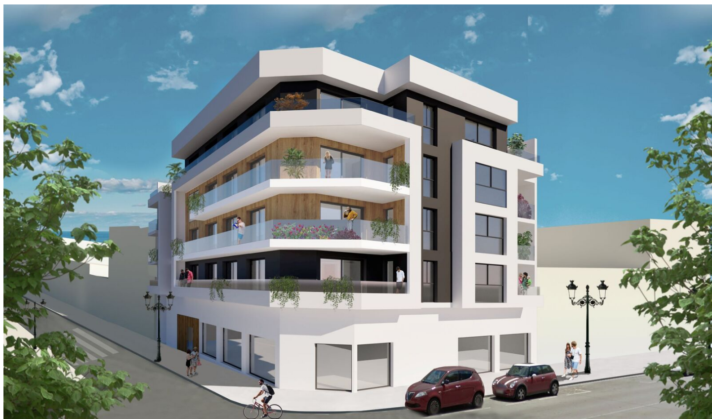
03140 Guardamar del Segura | Costa Blanca South | Project | Referentie: CBL12122-15074