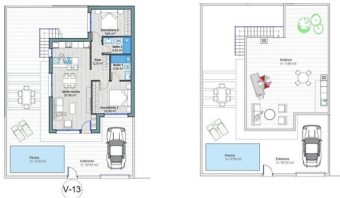
VIVIENDA Nº 13 Tot. Superf. 100,00 m 2 Superf. Constr. 100,00 m 2 Superf. Piscina 10,00 m 2 Superf. Jardín 10,00 m 2 Superf. Terraza 10,00 m 2 Superf. Parking 10,00 m 2 Superf. Otros 0,00 m 2