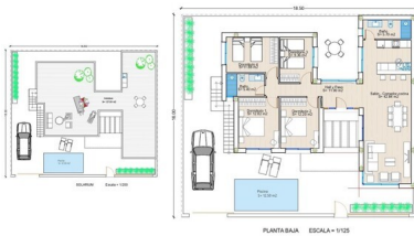
VIVIENDA Nº 4 Tot. Superf. 100,00 m 2 Superf. Constr. 100,00 m 2 Superf. Piscina 10,00 m 2 Superf. Jardín 10,00 m 2 Superf. Terraza 10,00 m 2 Superf. Parking 10,00 m 2 Superf. Otros 0,00 m 2