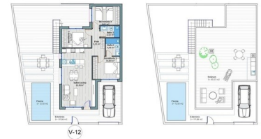
VIVIENDA Nº 12 Tot. Superf. 100,00 m 2 Superf. Constr. 100,00 m 2 Superf. Piscina 10,00 m 2 Superf. Jardín 10,00 m 2 Superf. Terraza 10,00 m 2 Superf. Parking 10,00 m 2 Superf. Otros 0,00 m 2