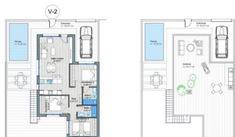
VIVIENDA Nº 2 Tot. Superf. 100,00 m 2 Superf. Constr. 100,00 m 2 Superf. Piscina 10,00 m 2 Superf. Jardín 10,00 m 2 Superf. Terraza 10,00 m 2 Superf. Parking 10,00 m 2 Superf. Otros 0,00 m 2