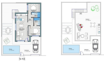
VIVIENDA Nº 13 Tot. Pisos: 2 Tot. Habitaciones: 3 Tot. Baños: 2 Tot. Superficie: 120,00 m 2 Tot. Precio: 1.200.000 €