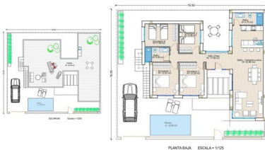
VIVIENDA Nº 4 Tot. Pisos: 2 Tot. Habitaciones: 3 Tot. Baños: 2 Tot. Superficie: 120,00 m 2 Tot. Precio: 1.200.000 €