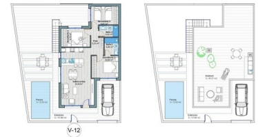
VIVIENDA Nº 12 Tot. Pisos: 2 Tot. Habitaciones: 3 Tot. Baños: 2 Tot. Superficie: 120,00 m 2 Tot. Precio: 1.200.000 €