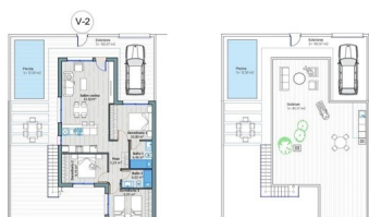
VIVIENDA Nº 2 Tot. Pisos: 2 Tot. Habitaciones: 3 Tot. Baños: 2 Tot. Superficie: 120,00 m 2 Tot. Precio: 1.200.000 €