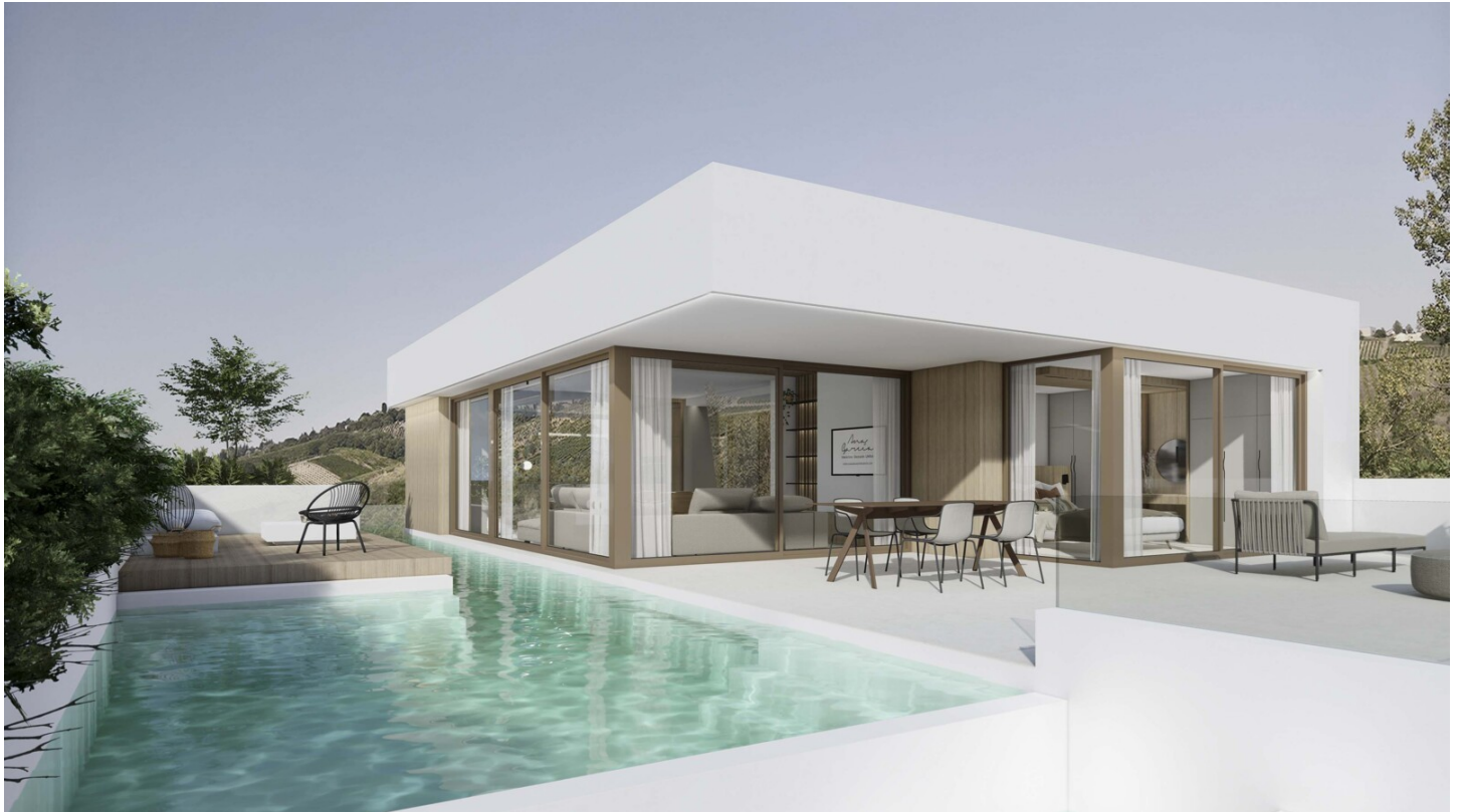
03509 Finestrat | Costa Blanca North | Project | Referentie: CBLN17046-15652