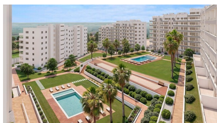
L'ouvrage mentionné en état de permis de construire est autorisé à être construit. Les plans mentionnés ne sont que des rendus artistiques. L'ouvrage mentionné est en phase de construction et sera livré en 100% achevé à l'achèvement de la construction.