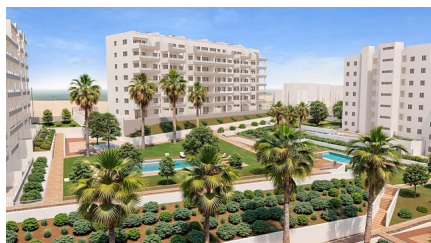
L'ouvrage mentionné en état de permis de construire est autorisé à être construit. Les plans mentionnés ne sont que des rendus artistiques. L'ouvrage mentionné est en phase de construction et sera livré en 100% achevé à l'achèvement de la construction.