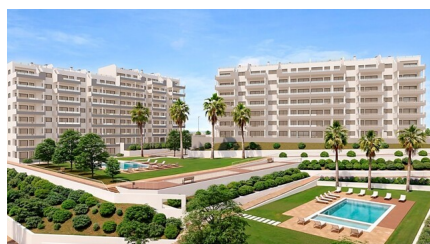
L'ouvrage mentionné en état de livraison complète au maximum 100% de son budget. Les travaux mentionnés dans les images sont purement illustratifs. L'ouvrage mentionné est en phase de construction et sera livré en 100% de son budget. Les travaux mentionnés dans les images sont purement illustratifs.