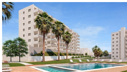
L'ouvrage mentionné en état de livraison complète au maximum 100% de son budget. Les travaux mentionnés dans les images sont purement illustratifs. L'ouvrage mentionné est en phase de construction et sera livré en 100% de son budget. Les travaux mentionnés dans les images sont purement illustratifs.