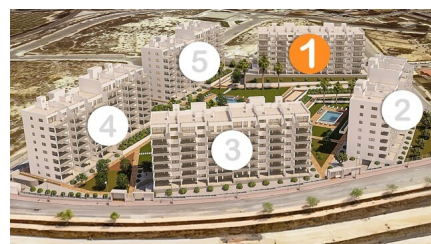
L'ouvrage mentionné en état de livraison complète au maximum 100% de son budget. Les travaux mentionnés dans les images sont purement illustratifs. L'ouvrage mentionné est en phase de construction et sera livré en 100% de son budget. Les travaux mentionnés dans les images sont purement illustratifs.